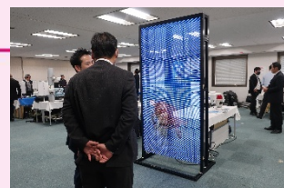
前回展示会の様子

・AIカメラ・クラウド型カメラ・顔認証システム ・レーザースキャンセンサ・防犯検知器・錠前 ・インターホンシステム等（予定）最新の防犯機器 を目で見て体感いただけます