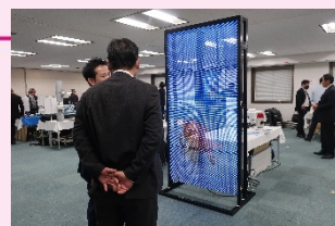
前回展示会の様子

・AIカメラ・クラウド型カメラ・顔認証システム ・レーザースキャンセンサ・防犯検知器・錠前 ・インターホンシステム等（予定）最新の防犯機器 を目で見て体感いただけます