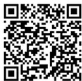
[2] スキルアップセミナー 参加申込書