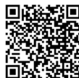
[3] 総合防犯設備士 資格更新手続きのご案内