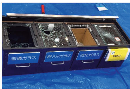
ガラス割りの実演