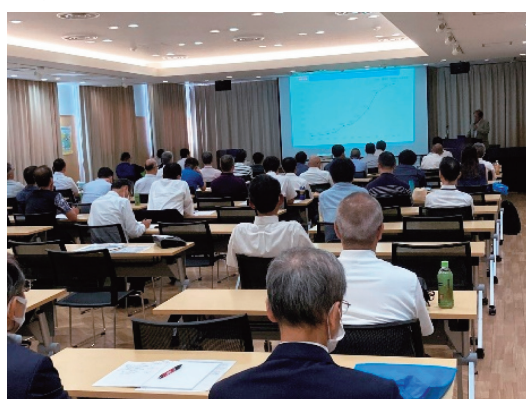
地域協会主催セミナーの様子