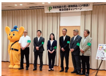
CP部品の普及促進キャンペーン